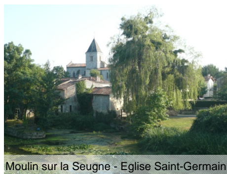
Moulin sur la Seugne - Eglise Saint-Germain

L'abbaye dépendait de celle de Saint-Germain-des-Prés, à Paris. Elle a laissé au village une partie de son nom.