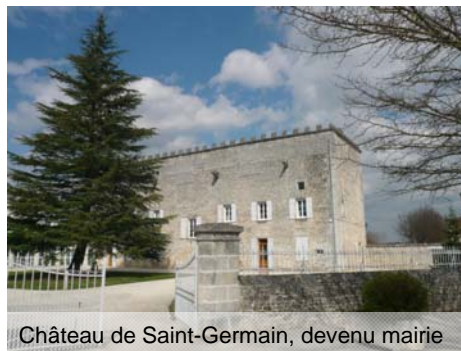
Château de Saint-Germain, devenu mairie

Plusieurs moulins sont situés sur la commune, à vent (Montcally) ou à eau (le Moulin, Cornet).